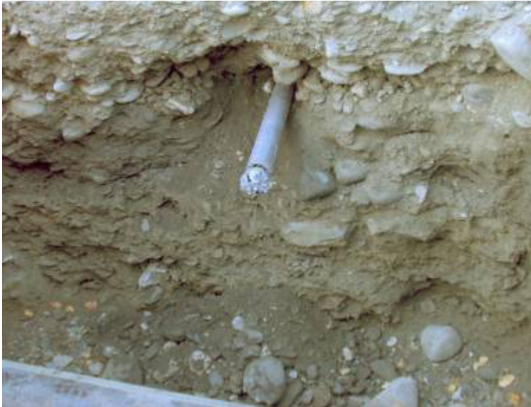
TERRA-ROCK ударная буровая головка достигла цели.